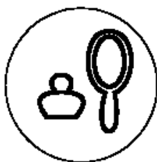
Рисунок 2 для парфюмерно- косметической продукции