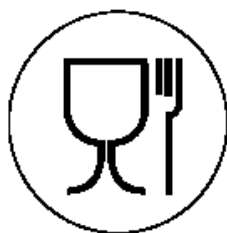
Рисунок 1 для пищевой продукции