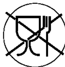
Рисунок 3 для непищевой продукции