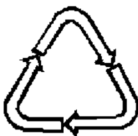
Рисунок 4 - возможность утилизации использованной упаковки (укупорочных средств) - петля Мебиуса